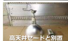
高天井セードと別置