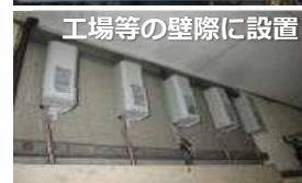
工場等の壁際に設置

【建物由来で探すことが重要】建物の建築時期が昭和52年(1977年)3月以前の場合、安定器にPCBが含まれている可能性あり