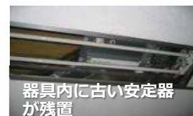
器具内に古い安定器が残置