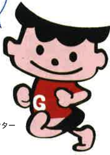
沖縄森永乳業 イメージキャラクター ゲンキ坊や