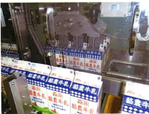
製品はクリーンな空気の中で製造されています

「私たち森永乳業グループではお客様に健康と幸せをお届けするべく、社員一同努力してきました。近年、弊社をとりまく環境はめまぐるしく変