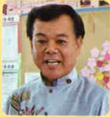
古謝景春 南城市長