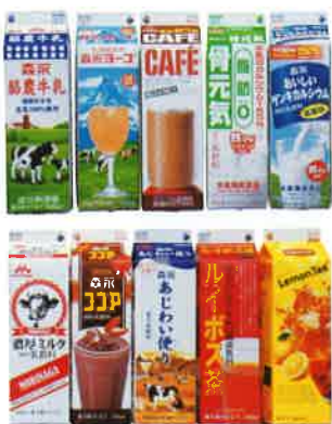
沖縄県民にはおなじみの製品がずらり

沖縄森永乳業では、時代の変化に寄り添い、これまで以上に高品質で『安心・安全』にこだわった製品を提供し続けるため、品質管理を徹底すると目標を掲げています。