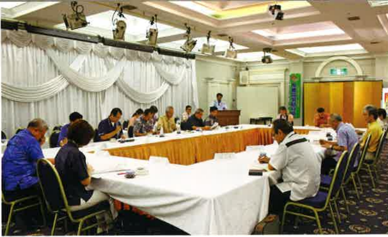
期間中の事業について様々な意見が活発に交わされました。

今年も7月の県産品奨励月間を迎えることとなり、第1回実行委員会がホテルロイヤルオリオンにて開かれました。