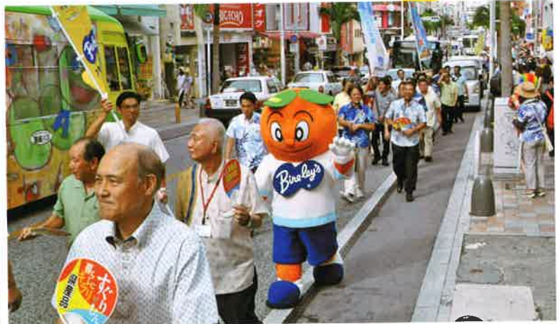
街の注目を集めながら、約 1.5 km の道のりを行進