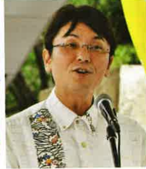
那覇市副市長 知念覚氏