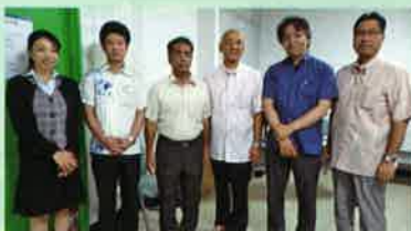
チーム ecowin 沖縄