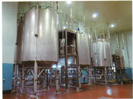
殺菌した製品を貯蔵するタンク群