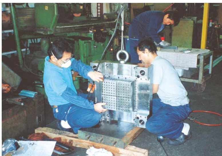
「緑化植栽用ターフ」の特注金型